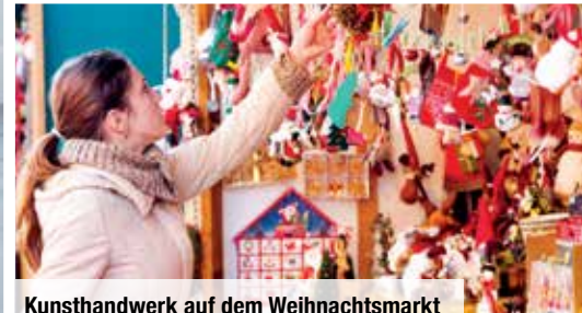
Kunsthandwerk auf dem Weihnachtsmarkt