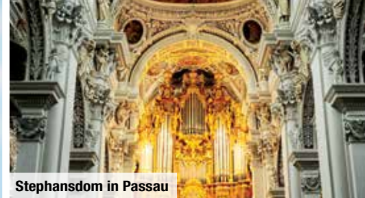
Stephansdom in Passau