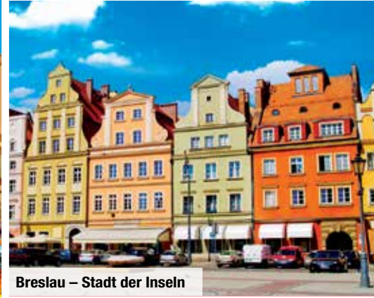
Breslau – Stadt der Inseln

Begeben Sie sich auf eine geschichtsträchtige Reise durch Schlesien! Sie logieren dabei sowohl in der mittelalterlichen Metropole Krakau als auch in der farbenfrohen Inselstadt Breslau in guten Mittelklassehotels. Neben den beiden Kulturmetropolen lernen Sie auch das ursprüngliche Schlesien kennen – bei einem Ausflug zu den verborgenen Städteperlen Kattowitz, Gleiwitz und Oppeln . Auch ein Besuch bei der berühmten Schwarzen Madonna von Tschenstochau ist bereits inklusive!