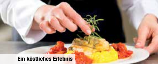
Ein köstliches Erlebnis