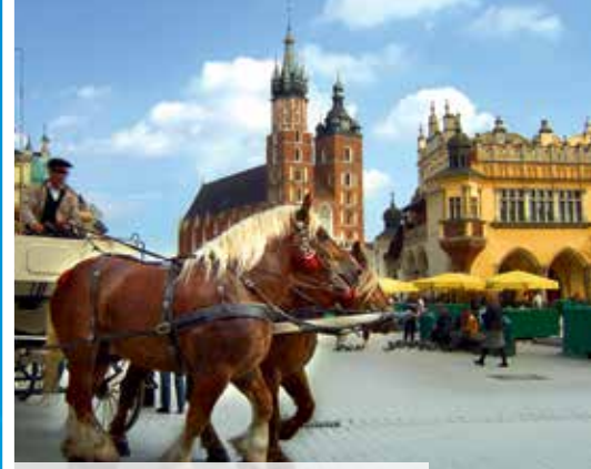
Krakau – ein architektonisches Juwel