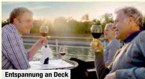
Entspannung an Deck

Bestaunen Sie die wichtigsten Sehenswürdigkeiten der Mozart-Metropole bei einer großen Entdeckungstour mit einem örtlichen Stadtführer. Freuen Sie sich z. B. auf die legendäre Ringstraße, die für ihre zahlreichen Prachtbauten berühmt ist. € 32 p. P. bei Vorabbuchung € 22 p. P.