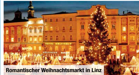
Romantischer Weihnachtsmarkt in Linz