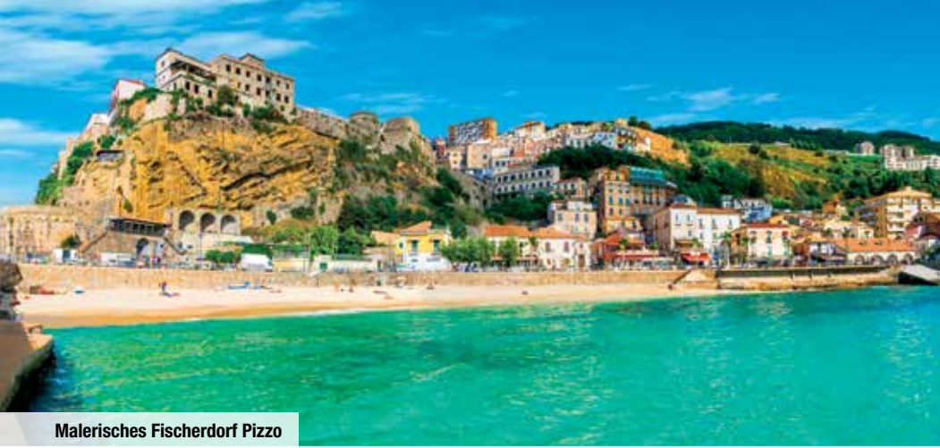
Malerisches Fischerdorf Pizzo