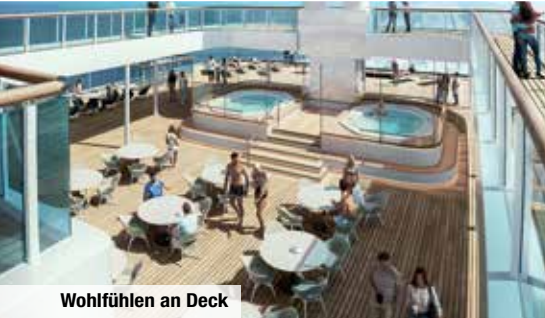
Wohlfühlen an Deck