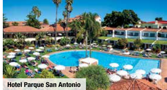
Hotel Parque San Antonio

Kuranwendungen & 4-Sterne-Hotel in Puerto de la Cruz inklusive!